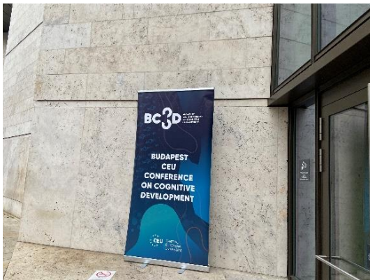
図 1 会場における掲示版